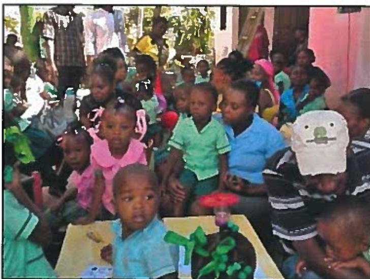
Le jeudi 8 décembre était la journée de la prise de photos avant la réouverture officielle du lundi 12 décembre 2016.