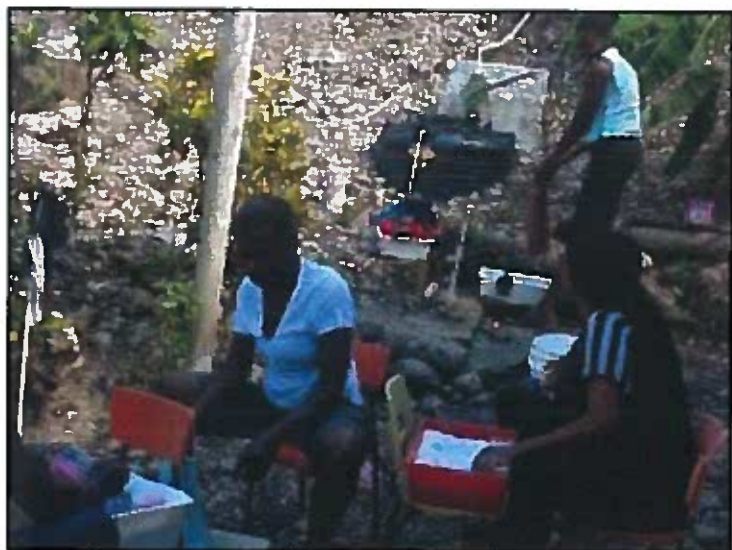
Les éducatrices et des parents bénévoles lavent les jouets et les vêtements souillés par les eaux de l'ouragan.

Nous avons de l'eau... Merci à la Fondation de la Salle!