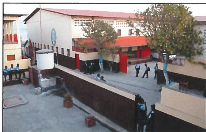
ÉCOLE PROFESSIONNELLE DE PORT DE PAIX, Haïti.

Le campus de Fatima est composé de trois écoles : École Notre-Dame de Fatima : 565 élèves, Collège Notre-Dame de Fatima : 205 élèves, un collège en croissance. Cette année nous avons la classe de seconde et l'École Nationale Technique et Professionnelle de Port de Paix (ENTP). C'est la seule école Technique avec autant de filières pour le département du Nord-Ouest. Cette année, ils sont seulement 87 : 48 en première année et 39 en deuxième année. Mais cela est en train de bouger.