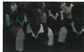
La première promotion du Collège