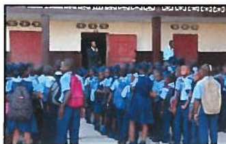
Les élèves du primaires du Campus de Fatima