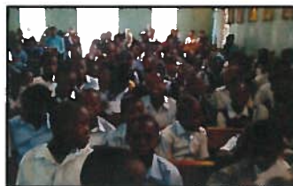
Élèves du Collège Notre-Dame de Fatima