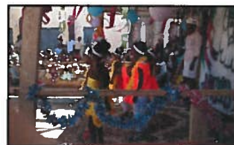
Fête de l'école Notre-Dame de Fatima