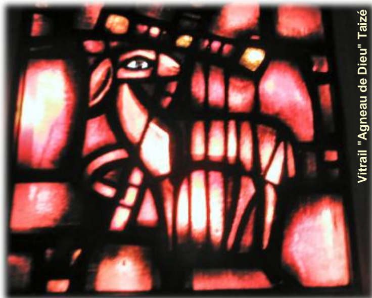
Vitrail "Agneau de Dieu" Taizé