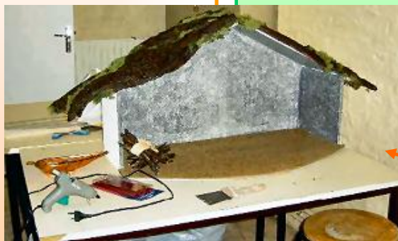
Crèches réalisés avec les élèves du lycée

Dès le III e siècle, les chrétiens vénèrent une crèche dans une grotte de Bethléem, supposée être le véritable lieu témoin de la Nativité.