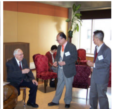
Photos de la visite des anciens élèves de Kagoshima