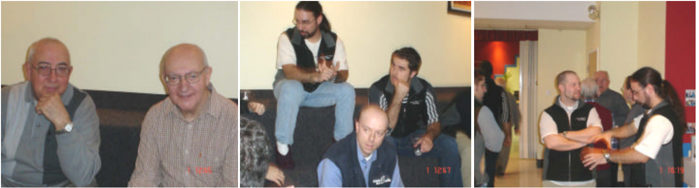
Autres photos de la rencontre des centres lasalliens de pastorale