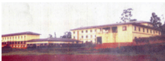
Collège Saint-Paul de Bafang