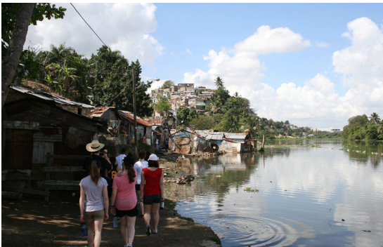
Barrio de Capotillo, près de Simon Bolivar

(Sur le site de l'Expérience Dominicaine) Depuis plus de six mois, nous sommes en réflexion pour donner la possibilité à 25 enfants du barrio Capotillo d'avoir leur petite école dans leur quartier. Un autre grand défi pour la grande famille de l'Expérience dominicaine. Les Frères des Écoles chrétiennes de Simon Bolivar ont un terrain dans ce barrio. Nous prenons le même modèle de la petite école de San Pablo dans le barrio Simon Bolivar. Il s'agit de commencer une levée de fond. Nous avons besoin de 21 000 $ . Ce montant comprend la construction de l'école et le salaire de deux enseignantes pour un an. La petite école se nommera Escuela de Hermano André Gauthier , en hommage au frère André Gauthier, un gourou en éducation chrétienne et qui portait l'Expérience dominicaine dans son cœur dès les débuts.