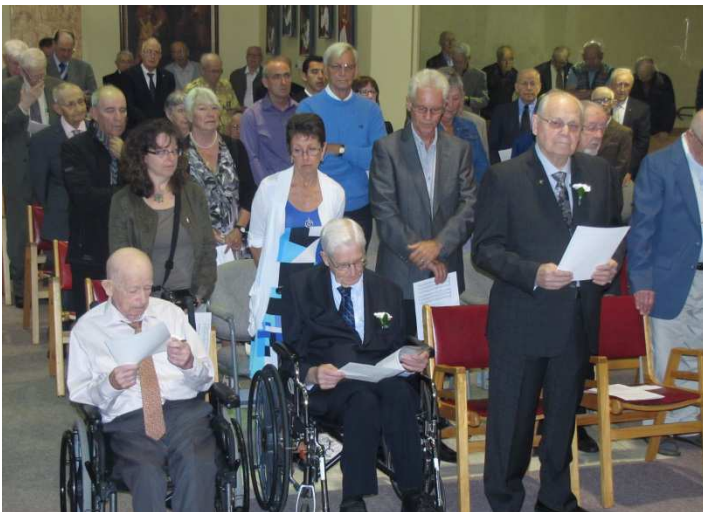
Résidence De La Salle : Une partie de l'assistance