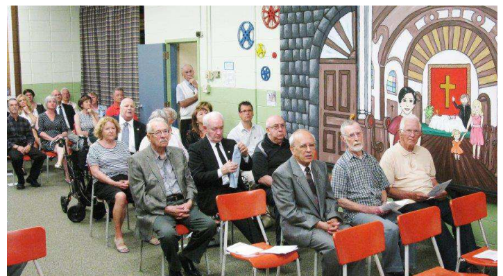
Villa des Jeunes : Une partie de l'assistance