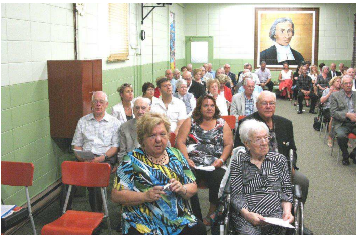
Villa des jeunes : Une partie de l'assistance