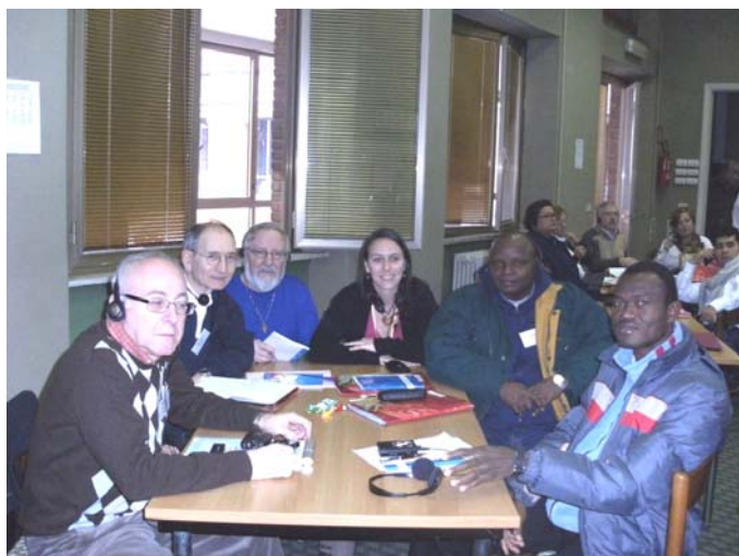
Ma petite équipe de travail

Depuis le 24 janvier 2009, nous sommes tous réunis sous le même toit au CIL (Centre International Lasallien), à la maison généralice de Rome. Nous voilà déjà rendus à notre dernière semaine. Le temps a passé très vite, malgré quelques périodes d'ennui. Nous sommes 29 laïcs et laïques arrivés de partout dans le monde pour travailler avec 30 frères qui étaient déjà ici. Le module frères et laïcs s'intitule : « La Déclaration : une relecture après 40 ans ». Les sessions de travail se passent en français, anglais et espagnol. Heureusement que nous avons des traducteurs. Nous pratiquons tout de même un peu l'anglais et l'espagnol. Puis, lorsque l'on va se promener à l'extérieur de la maison, il faut parler italien.