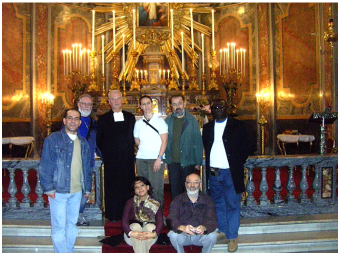
Chapelle de l'école San Giuseppe Pèlerinage Gabriel Drolin – Groupe francophone