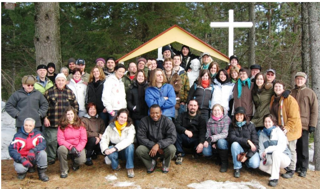
Groupe des participants à la montée pascale