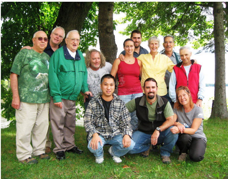
Photo d'équipe prise au début septembre 2010.