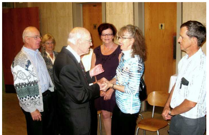
Avec des gens de sa parenté