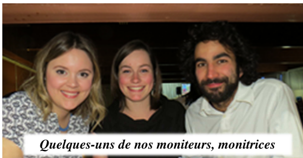
Quelques-uns de nos moniteurs, monitrices

Voici en quelques chiffres un aperçu du Fonds-Jeunesse et des derniers soupers bénéfiques :