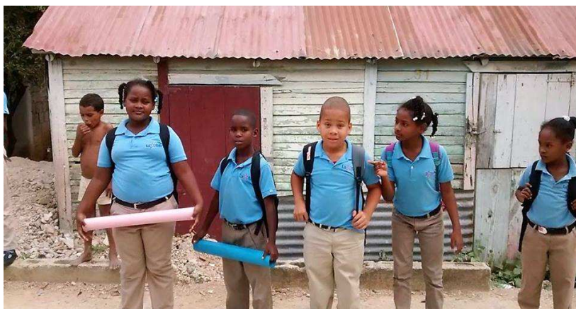
La photo a été prise à la sortie des classes de l'école à Higüey, école tenue par les F.É.C.

Nous sommes de retour du voyage humanitaire en République Dominicaine... Ce projet missionnaire est le fruit de longues réflexions (juillet à mars) en lien avec soi, avec les autres et avec le Christ. Les orphelinats Nuestros pequeños hermanos (NPH) sont dans neuf pays sous-développés et valorisent la prière, la foi, l'amour, le service et la paix.