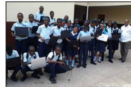
Les apprenants peuvent travailler seuls sur un ordinateurs. Bravo !

Je profite de ce moment pour vous remercier d'avoir accepté notre projet d' Achats d'ordinateurs pour les apprenants du Collège Notre Dame de Fatima . Grâce à votre aide nous avons acheté 23 ordinateurs. La fondation De La Salle a participé à l'achat de 15 ordi-